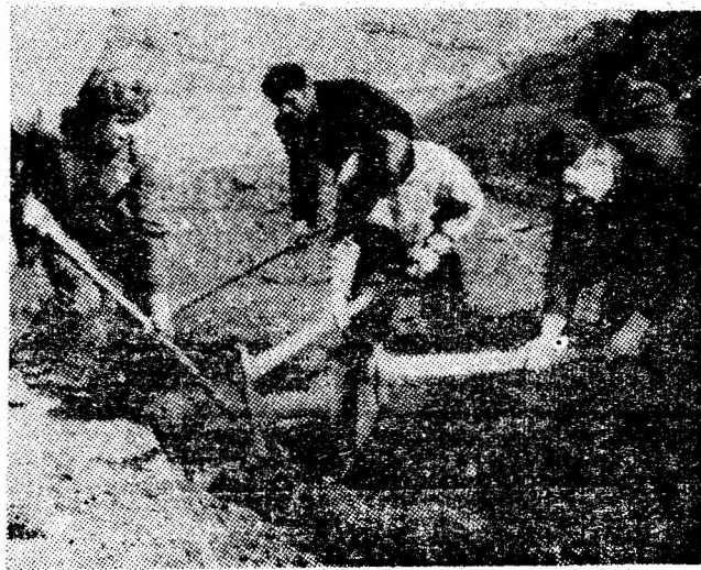
La Lăpeni se înlătură „rămășițele” iernii.