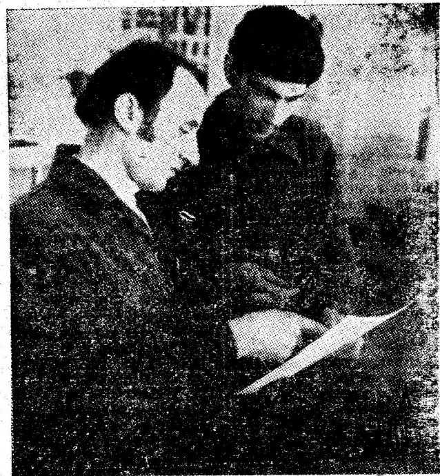
Oră de practică la Școala generală Uricani.

Pe terenul de sport al Școlii generale din Uricani a avut loc un meci amical de handbal între elevii școlilor din oraș.