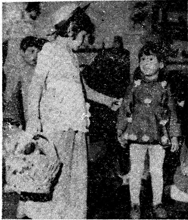
Secvență dintr-un spectacol prezentat recent de școlii patriei de la grădinița nr. 5 din Lupeni.

• La căminul cultural din Cîmpa (ora 19) este programată o seară tematică intitulată „Comori ale artei hunedorene”. Este vorba de un ciclu de manifestări care își propune să facă cunoscute valorile ale artei populare din județul Hunedoara.