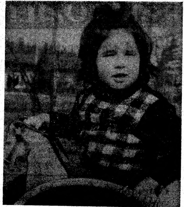
„Di, căluțul meu!”