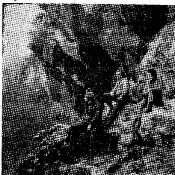
Popas pe versantul drept.