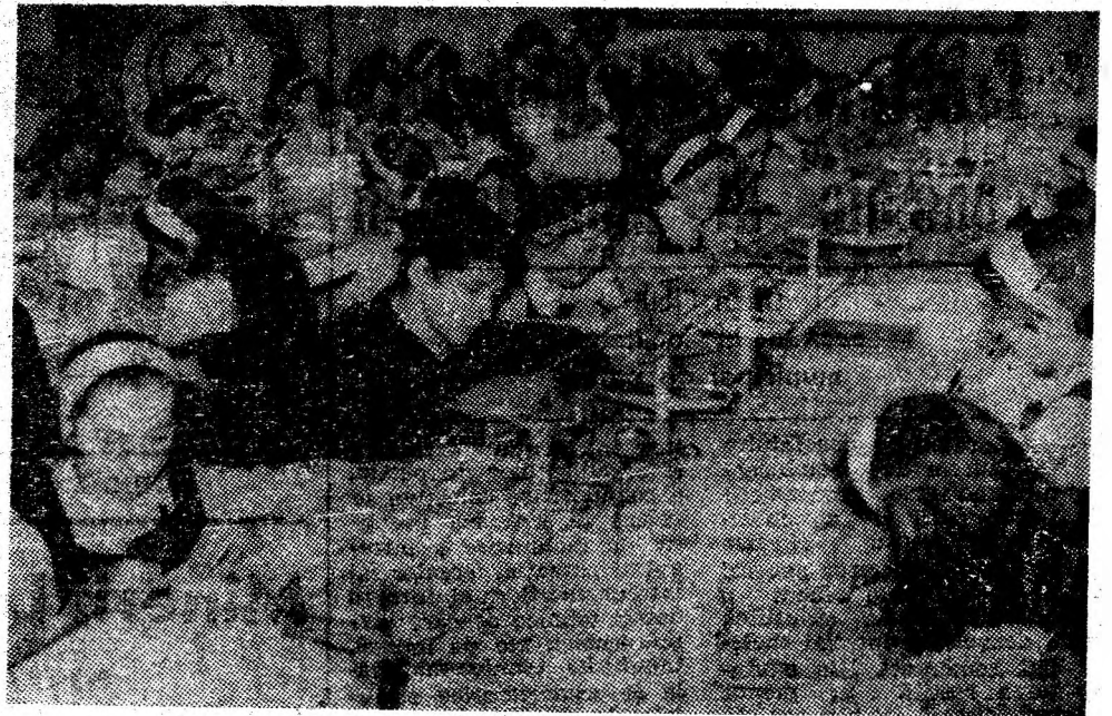
Oră de merceologie în modernul laborator al Liceului economic și de contabilitate din Petroșani.