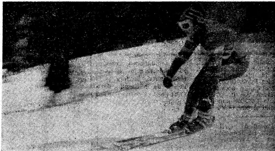
„Cupa Minerul” de la Straja Lupeni.