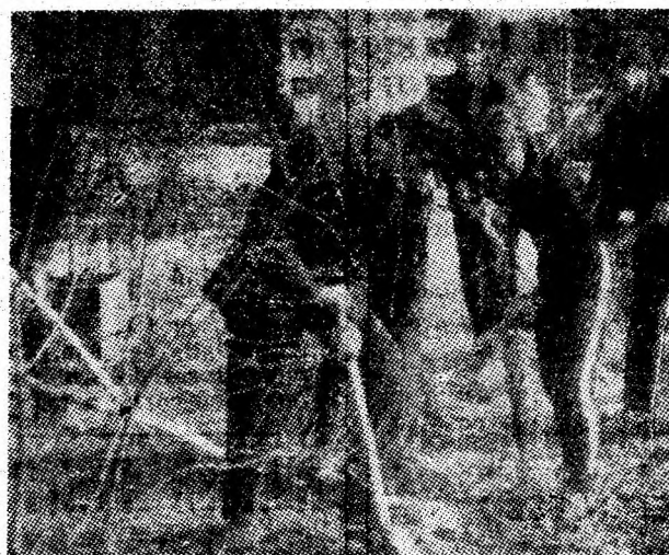
Elevii Liceului industrial din Vulcan au fost prezenți în această săptămînă la acțiunile gospodărești și de infrumusețare a orașului.

ces pentru care colectivul nostru se străduiește foarte mult. Dar cel mai mare câștig al minei va fi acela că față de situația actuală, o mare parte din lucrări vor fi mecanizate. Și, cum e și firesc, rodul mecanizării se va vedea într-o etapă viitoare, cînd tot colectivul nostru va beneficia de avantajele ei. Oricum, anul în curs va însemna un an deosebit de rodnic pentru minierii Petrilei.