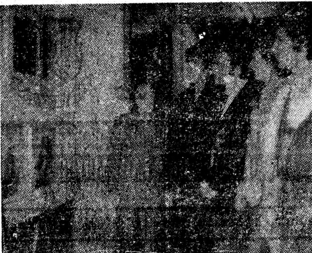
Aspect de la expoziția de fotografii deschisă în holul Casei de cultură din Petroșani, cu ocazia Festivalului artei studentești.