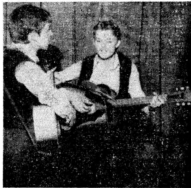
Muzica folk își găsește tot mai mulți adepți și în rîndul tinerilor din municipiul nostru.