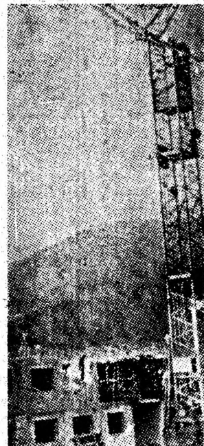
Noi verticale ale prezenței.