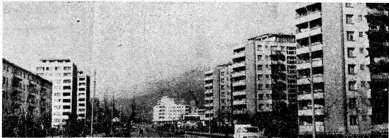
Noul chip al orașului Vulcan.