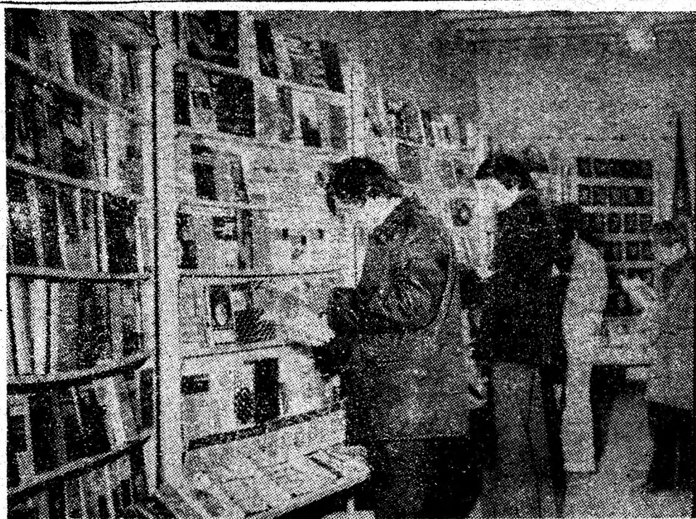
Instantaneu de la expoziția de carte organizată la Casa de cultură din Petroșani cu prilejul „Decadei cărții în Valea Jiului“.

mînd „o evoluție întristătoare“, cum spunea Ov. S. Crohmăniceanu. „Din feciere — observă I. D. Bălan — biografia și destinul operelor mari nu se confundă cu viața și soarta creatorilor lor“. Aron Cotruș este considerat, alături de Lucian Blaga și Octavian Goga, unul dintre poezii ardeleni reprezentativi, descinzînd — prin tematică și spirit mesianic — din cel de al doilea. Aron Cotruș e din familia poezilor barocului giganticului, ai mesianismului apocaliptic (linia Walt Whitman, Verhaeren, Blok, Bjelky, Esenin), printr-un impuls organic... Toate dimensiunile universului