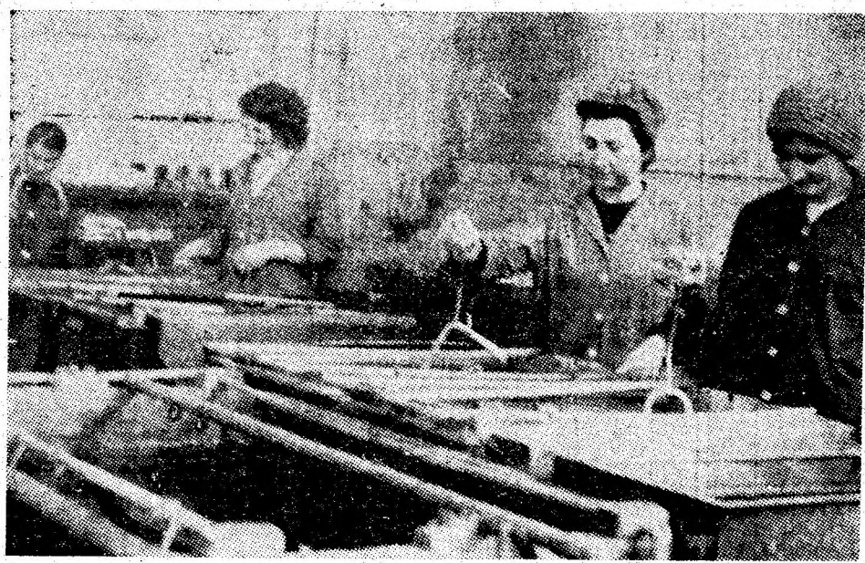
Secția de galvanizare a S.S.H. Vulcan.