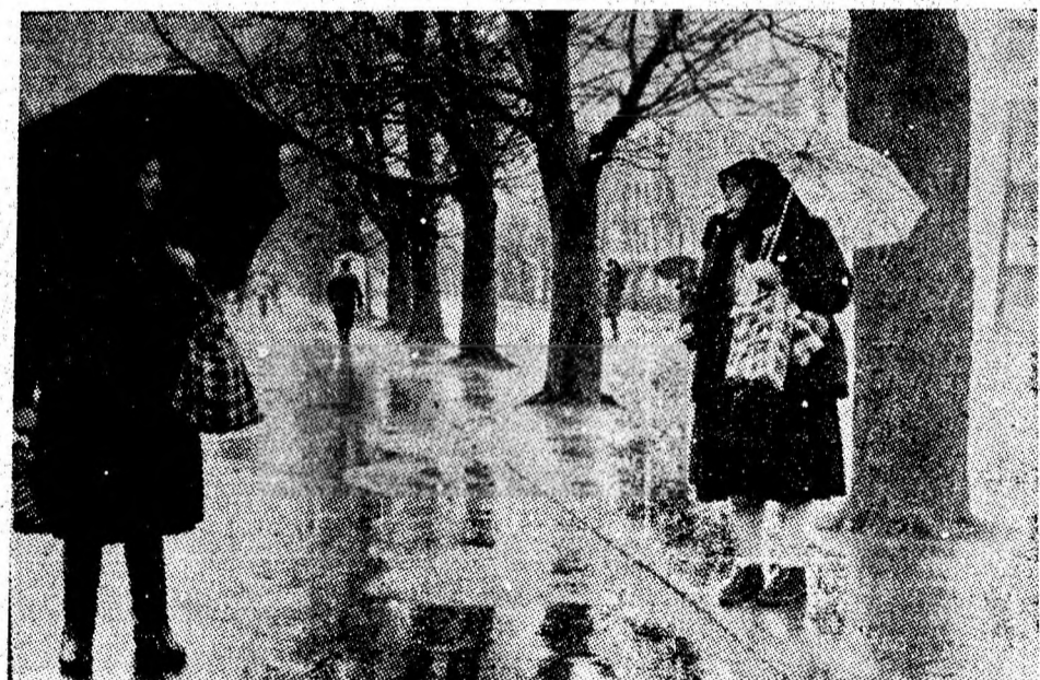
— Ce zici de primăvara asta?!