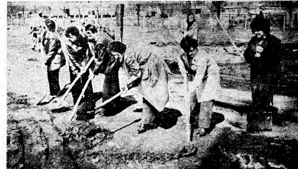
Personalul TESA de la Preparația Coroesti în cadrul unei acțiuni de muncă patriotică pentru curățirea și infumusețarea incintei uzinei.

— Rămînînd în „subsolul” clasamentului, numai