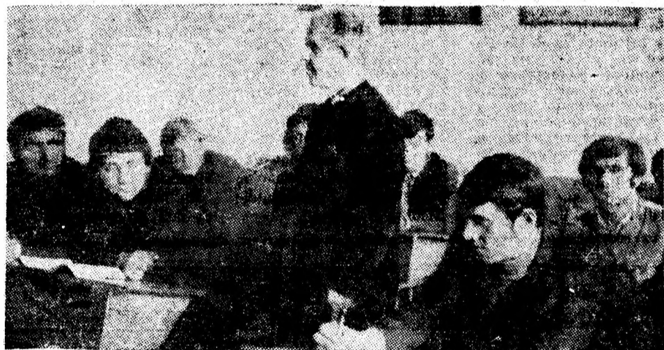
În cadrul cursurilor de calificare, noii încadrați în muncă își însușesc cunoștințele necesare pentru a deveni buni mineri-tehnicieni.

La I.M. Aninoasa există însă un neajuns care se cere înlăturat în cel mai scurt timp. Este vorba de sala în care se țin cursurile școlii de calificare. O singură sală se dovedește insuficientă. Uneori graficul prin care se prevede ținerea cursurilor nu poate fi respectat deoarece sala este ocupată cu alte acțiuni organizate la nivelul întreprinderii.