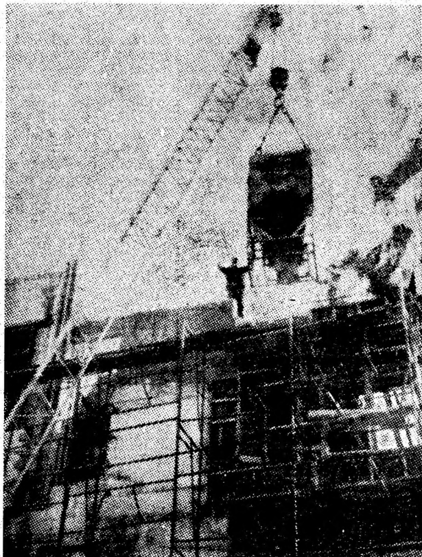
Ritm susținut de lucru pe șantierul fabricii de confecții din Vulcan.