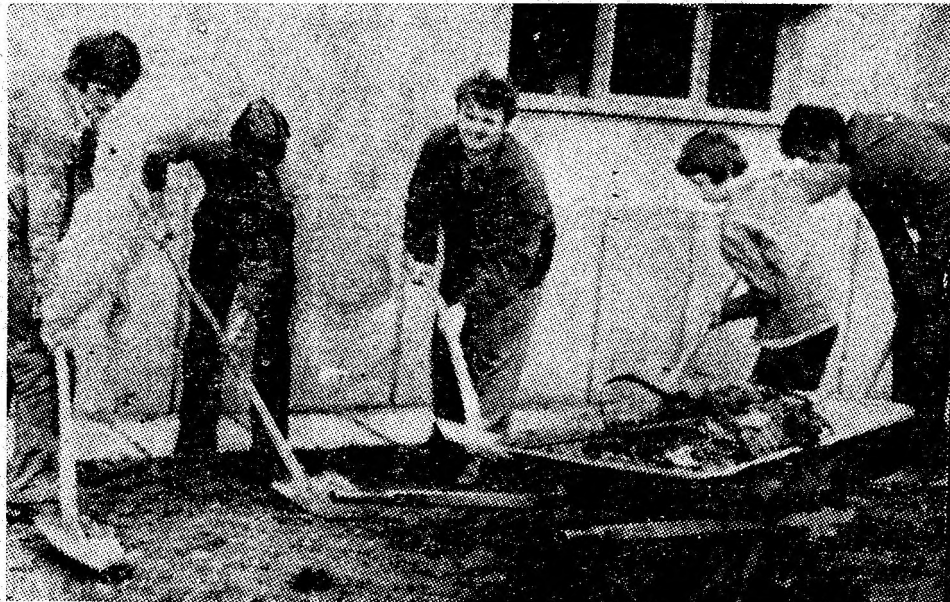
Locatarii blocului D11 din cartierul Viscoza Lupeni, în plină activitate gospodărească.