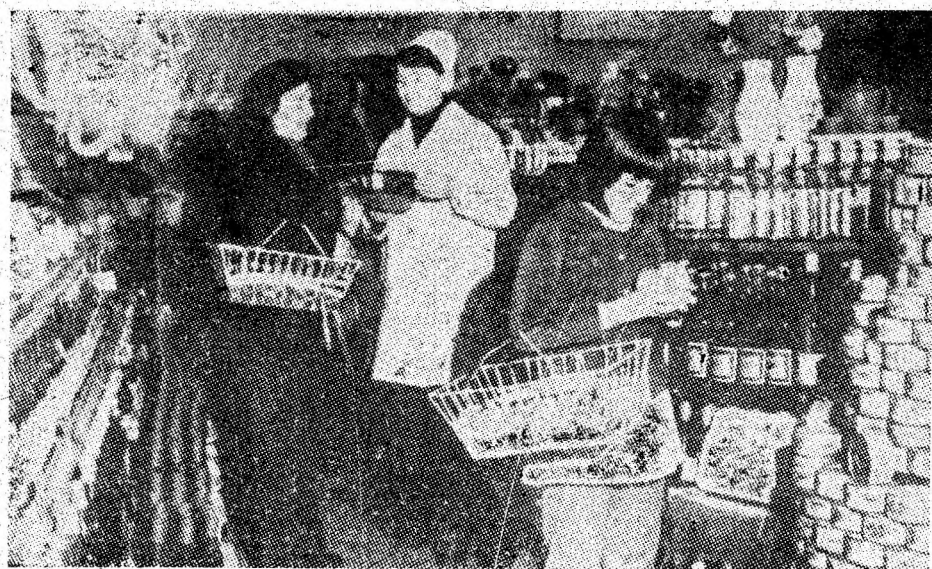
Aprovizionare bună, servire civilizată. Instantaneu în complexul alimentar „Mercur” din orașul Vulcan.

În sprijinul absolvenților de liceu care susțin examenul de bacalaureat în sesiunile anului 1979, Ministerul Educației și Învățămîntului a elaborat broșura „Examenul de bacalaureat — 1979”. Broșura, cuprinzînd normele de înscriere, organizare și desfășurarea examenului de bacalaureat din acest an, precum și lista manualelor școlare, pe baza cărora se va susține examenul, este tipărită în tiraj de masă și va putea fi procurată prin unitățile de difuzarea presei din întreaga țară, începînd din 17 aprilie.