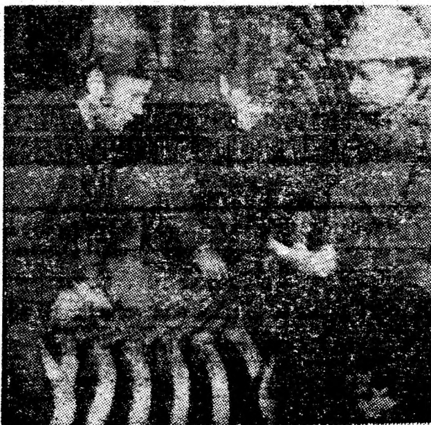
O operație de mare răspundere la Uzina electrică Paroșeni: verificarea bobinajului.