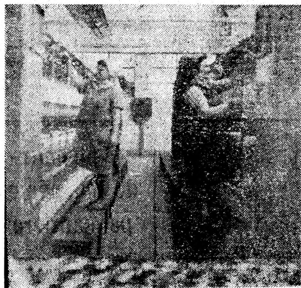
Aspect din secția răsucit a I.F.A. „Viscoza” Lupeni.

care va marca trecerea la sistemul de autotaxare. O altă veste. Venind în întîmpinarea solicitărilor oamenilor muncii de la I.M. Lonea, conducerea E.T.P. a hotărît ca autobuzele ce deserveau liniile Petroșani — Lonea și Petroșani — Cîmpa-Râșcoala să intre, la întoarcere, prin cartierul 8 Martie, pentru a facilita coborîrea călătorilor din acest mare cartier cît mai aproape de locuințe.