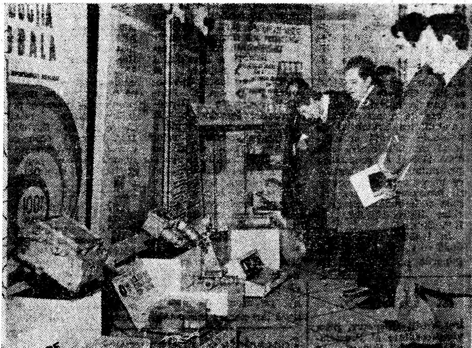
Participanții la consfătuire privesc cu viu interes ultimele creații tehnice realizate de colectivul de la I.U.M. Petroșani.