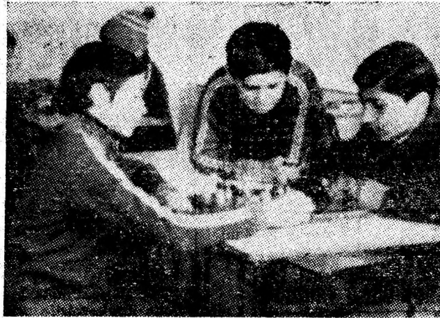
Instantaneu din „Clubul vacanței” ce a funcționat la Școala generală din Uricani.