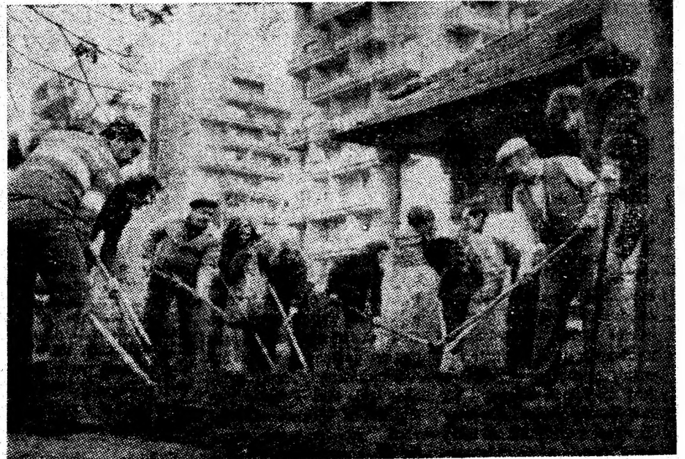
Gospodari din blocurile turn, strada Republicii, Petroșani? Aș! Un colectiv de la C. C. S. M. angrenat în amenajarea spațiului verde din cartier. Unde sînt totuși locatarii? Privesc de după perdele...

Echipe de muncitori pavatori a E.G.C.L. și-a intensificat munca și a executat deja plombări pe străzile Republicii, Vasile Conta, Cloșca, I.B. Deleanu, îmbrăcăminte asphaltică a străzii Petőffi Sandor, acțiune care va fi continuată pe străzile Oituz, Unirii, Aviatorilor și altele. Personalul Oficiu-