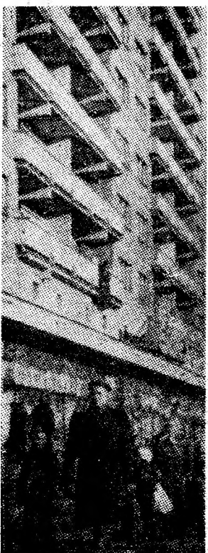
Zi însoțită de primăvară.