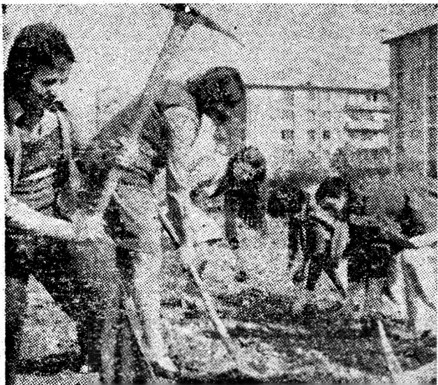
Personalul TESA de la Fabrica de tricotaie din Petroșani angrenat într-o acțiune de muncă patriotică la curățenia orașului.