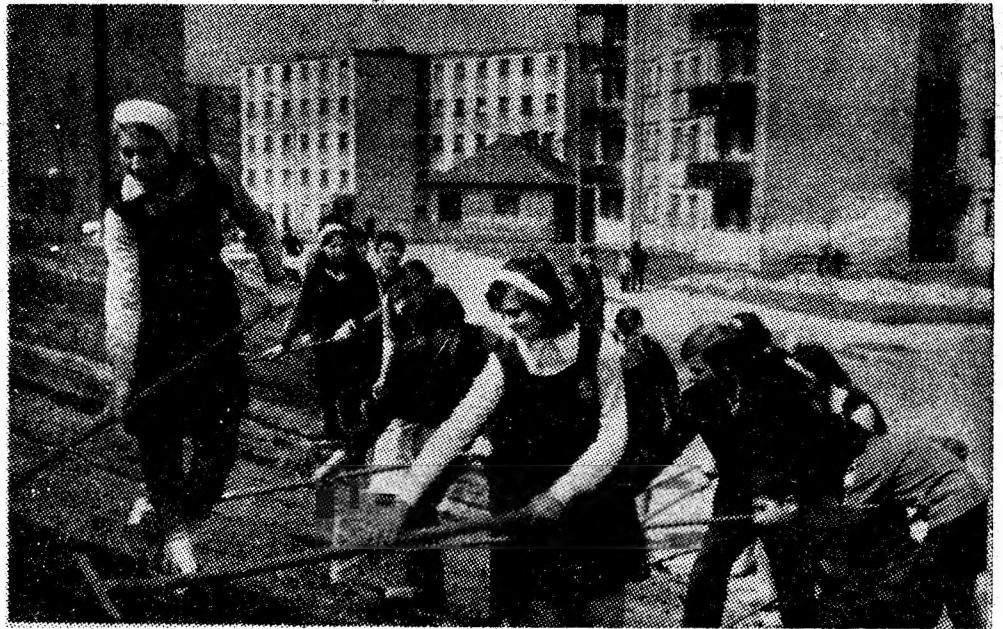
Lupeni. Tineri elevi într-o acțiune de muncă patriotică. Se finalizează contururile unui taluz pe care se va semăna iarbă.