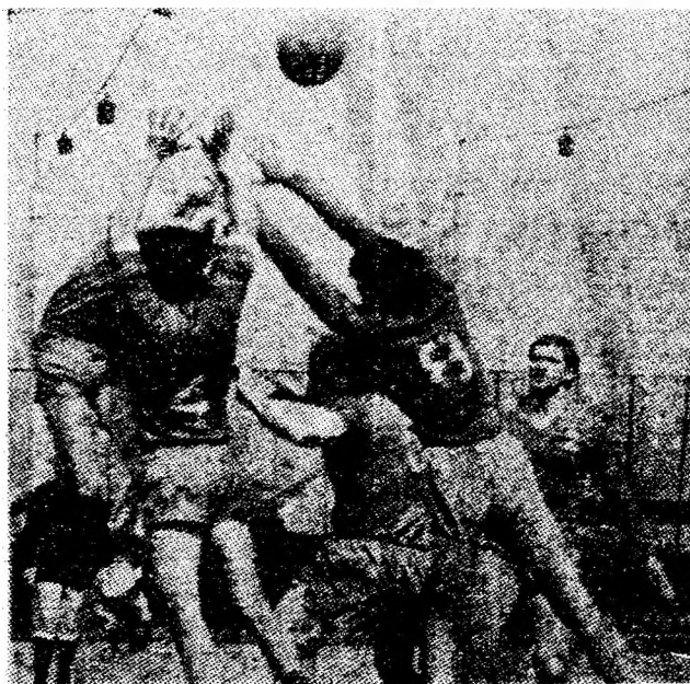
Un atac al echipei noastre străpunge blocul adversarilor înscriind un nou gol.