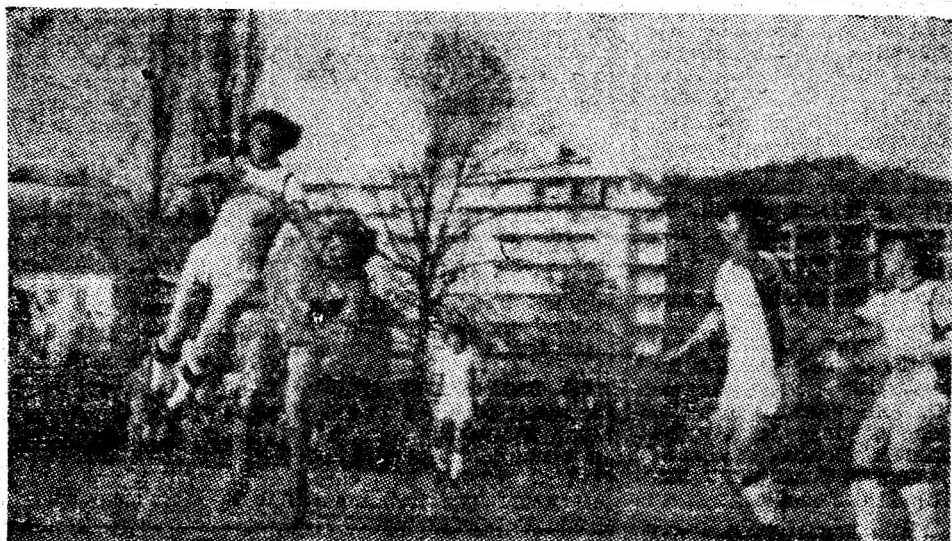
Al treilea gol al Jiului.

Partida se anunță deosebit de interesantă, cavalerii fluielului, de data aceasta în postură de fotbaliști, propunîndu-și să ofere o adevărată lecție de fotbal-play. (C.I.)