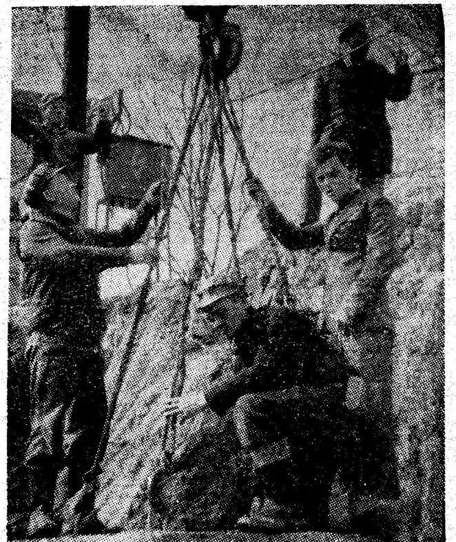
Se așază cușineții prefabricați în care se introduc stilpii de rezistență ai noii tipografii din Petrosani.