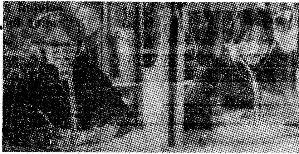
Instantaneu din modernul laborator fonic al Liceului de matematică fizică din Petroșani.