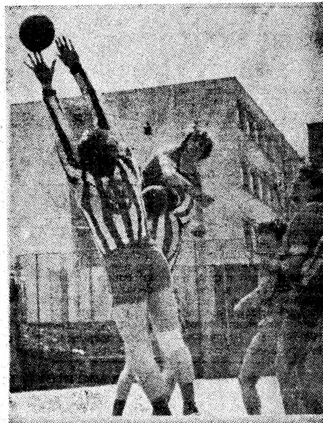
Șut puternic și, încă un punct pentru zestrea de goluri a echipei Utilajul-Știința din Petroșani.