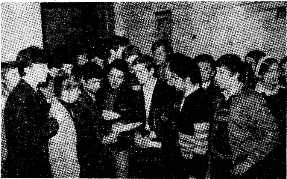
O privire pe filele unei broșuri despre singele salvator de viață, cu cîteva minute înainte ca tinerii din clasa a XII-a B a Liceului industrial minier din Petroșani să devină... donatori.