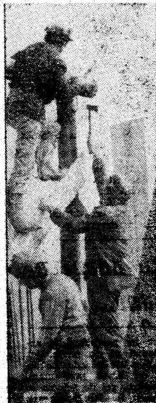
Tot mai sus.

Repriza a doua debutează cu atacuri ale gazdelor care vor rata prin Cik, Mora, Fița. „Răzbunarea” ocaziilor ratate îi va costa în min. 62 cînd Kalay va face o cursă de 40 metri, va înscrie pe lingă portar și Preparatorul Petrila conduce cu 2—0. În continuare, preparatorii recurg la artificii și pe fondul acesta, David va înscrie pentru gazde în min. 88, reducînd din handicap. (Dorel NEAMȚU)