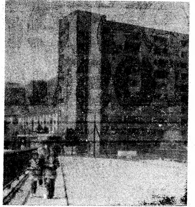
Uricani — oraș nou, în continuă devenire.

Firește că nici organizarea, oricât de riguroasă, și nici dotarea de care beneficiem nu pot asigura, singure, eficiența pe care am dorit-o. A c e a s t ă eficiență decurge din atenția cu care comitetul de partid se preocupă de îndeplinirea fiecărei acțiuni prevăzute în planul