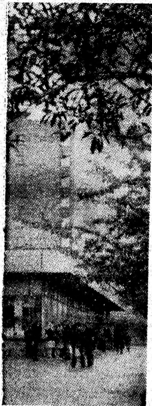
Secvență din Petrița de azi — un oraș modern, în plină dezvoltare și înflorire.