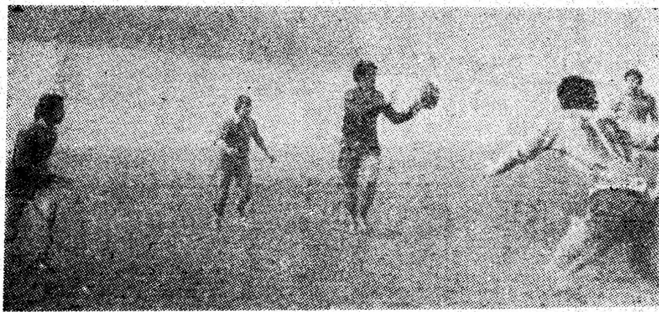
O acțiune pe „trei sferturi” a rugbiștilor de la Știința.

ETAPA VIITOARE: su — Laminorul Nădrag, Gloria Reșița — C.F.R. Simeria, Vulturii textila Lugoj — C.I.L. Blaj, Știința Petroșani — Unirea Alba Iulia, Metalul Bocșa — Electromotor Timișoara, Metalul Oțelu Ro-