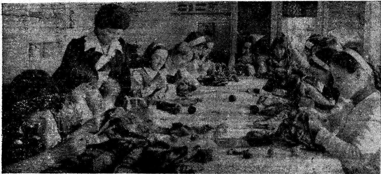
In lumea măiestriei artistice. Instantaneu dintr-o oră de practică la clasa a VIII-a B de la Școala generală nr. 6 din Petroșani.