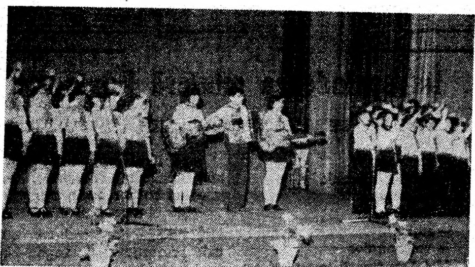
Pe scena marelui festival al muncii și creației, purtătorii cravatei roșii.

O mîină de pionieri, cu ochii plini de lumina vieții noi pe care o trăiesc, înundă scena cu versul, cîntecul și dansul. Ei cîntă realitățile noi, socialiste, viața fericită și plină de bunăstare a omului nou, orașul lor — Petrila — munca eroică a părinților lor, minerii. I-am văzut pe scena primului Festival național „Cintarea României”, cînd, cu spectacolul „Cin-