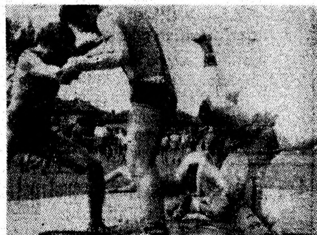
Luptătorii noștri fac o demonstrație de virtuozitate în fața publicului snectator.

Încă de la primul fluier arbitrului, meciul are un ritm viu cu faze de gol la ambele porți. Primii care înscriu sînt jucătorii din Lupeni în minutul 11. A marcat Voicu. Pandurii forțează și reușesc egalarea în min. 37. În minutul 45 conduc gazdele cu scorul de 2-1, scor cu care ia sfîrșit prima repriză. Nu trec decît 7-8 minute de la reluare și Pandurii înscriu un nou gol, iar în minutul 62 îl majorează la 4-1. Se părea că scorul va lua proporții deoarece în minutul 70 gazdele beneficiază de o lovitură de la 11 metri, iar în poarta echipei Minerul se află tînarul jucător din propria pepinieră, Grigore, care se remarcă apărînd lovitura de pedeapsă. În minutul 80 oaspeții înscriu un gol frumos. Leca face o incursiune pe partea dreaptă, trece de doi adversari, iar balonul centrat este reluat în poartă de Zlate. Deși oaspeții au în continuare inițiativa, fluierul final consfințește pînă la urmă victoria cu 4-2 a gazdelor care încheie astfel cu încă un succes ultimul meci înainte de revenirea în divizia B.