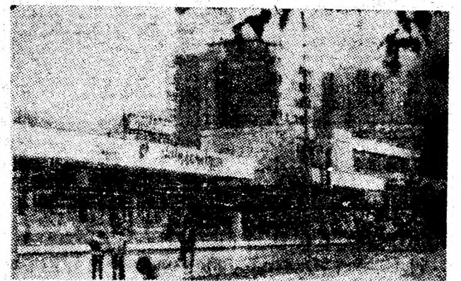
Vulcanul sub soarele de iunie.