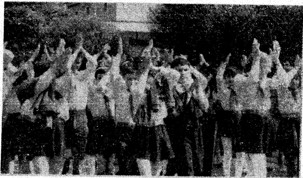
Pionierii, viitorul patriei