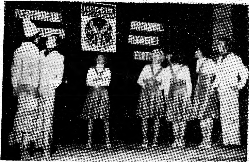
Moment din programul brigăzii artistice a întreprinderii miniere Vulcan, susținut de curind la „Nedeia vulcăneană“.