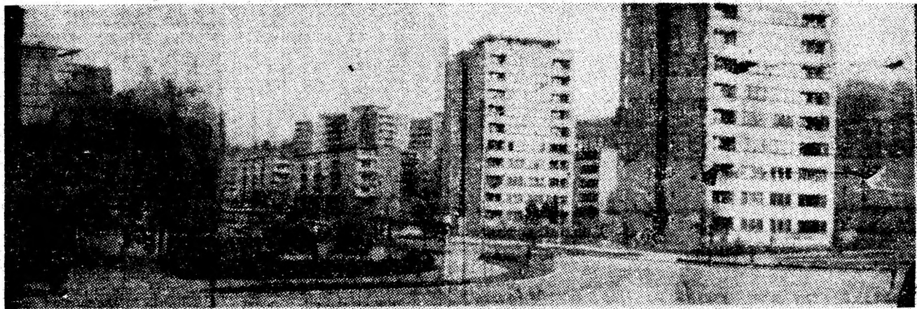
Vulean — filă de armonie arhitectonică.