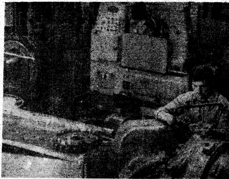
Tînărul frezor Iosif Benko din secția mecanică a I.U.M. Petroșani surprins pe peliculă în timp ce lucrează simultan la mai multe mașini.