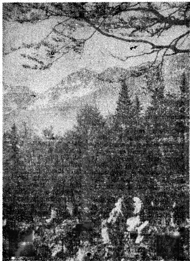
Zile de vară în Muncelul Jiului.

In altă ordine de idei apropierea toponimică Bănița, Crivadia, Oboroca, Jigor și Jigoreasa este