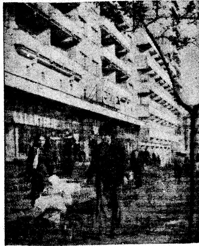
Pe noua și modernă arteră a Petroșaniului.