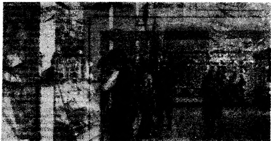
Recent deschis, după efectuarea unor lucrări de modernizare și înfrumusețare, magazinul nr. 267 din cartierul „Viscoza” Lupeni etalează pe deplin atribuțiile unui comerț civilizat. Dovada acestui fapt o constituie și numărul mare de cumpărători care trec zilnic pragul magazinului, atrași de varietatea mărfurilor pe care le găsesc aici.

De la începutul anului, E.G.C.L. Petroșani a efectuat reparații capitale la peste 80 de blocuri, iar reparații curente la peste 600. De asemenea, au fost verificate un număr important de centrale și puncte termice în vederea funcționării corespunzătoare în perioada de iarnă. Valoarea lucrărilor executate în primul semestru se ridică la mai multe milioane lei. (C. Val)