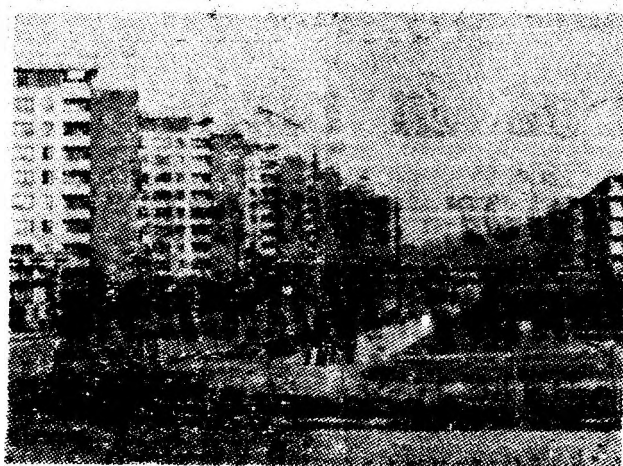
Noi și moderne blocuri se integrează armonios în urbanistica Văii Jiului.