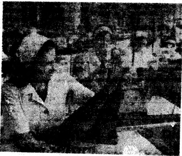
La noua fabrică de confecții din Vulcan se produce din plin.