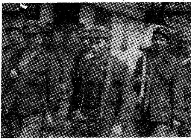
Mineri din brigăzile fruntașe ale sectorului IV al minei Lupeni, ies din șut.