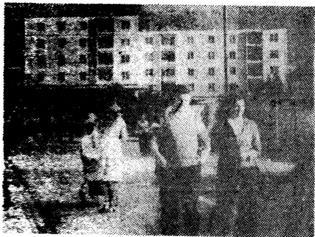
Zi de august pe una din arterele Lupeniului.