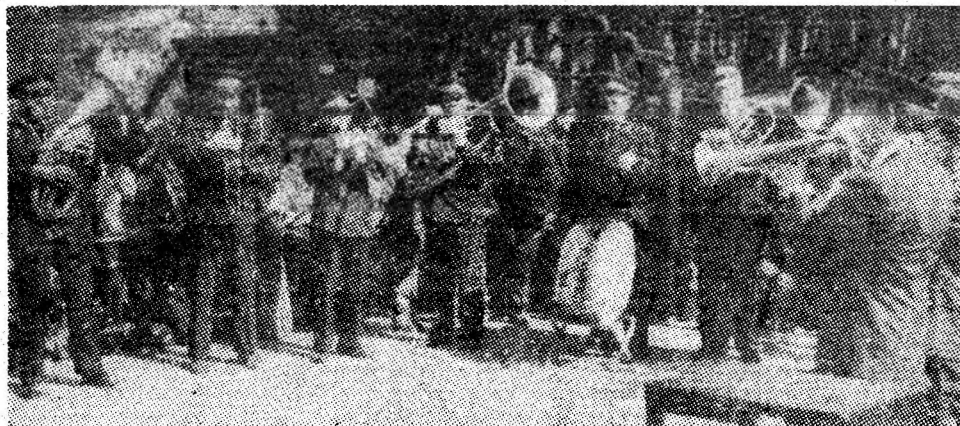
Fanfara minerilor din Vulcan prezintă un frumos și atractiv program de cîntece pentru oamenii muncii veniți să-și petreacă timpul liber în cadrul pitoreștilor serbări cîmpenești organizate la locurile de agrement.

este structurată în două secțiuni tematice: mine-rit (deschisă la Muzeul mineritului) și istoria patriei (la Casa de cultură). Cu acest prilej au fost emise un plic omagial cu ștampilă, 6 întregiri poștale cu imagini din Lupeni precum și maxime-filie. Această frumoasă manifestare cuprinde pasiunea și strădaniile cercetătorului filatelic „Minerul”, alăturîndu-se multiplelor acțiuni desfășurate în cinstea Zilei minerului și aniversării celor 35 de ani de la Eliberare.