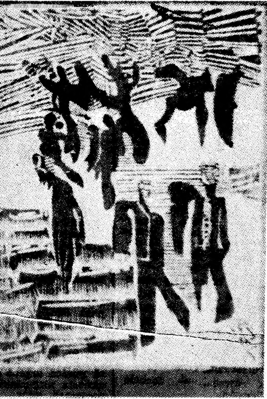
„Oameni, lumini” xilografură de Simion Costea.

sului minei sînt diverse. Iată drumul de la „Afară-i vară, soare. Adîncu-i veșnic orb / Ciocanul roade stîncă, din grindă, plouă colb”, pînă la pateticul, dar profundul „În cuibul rece de huiță / Dorm cîntece de albe scoici / Simt marea în vuietul de roci / Și-n cîmp virgin îmi cîntă porii / De azi va clocoli sudoare / Pe țărmul erei scufundat / Panonic val coagulat / Va arde-n templul de istorii”, versuri aparținînd lui Augustin Țanca. Îndrăznim să afirmăm că poezia scrisă de minerii, poezia minei, se înalță ca o flacără vie în panteonul de valori culturale. Mircea BUJORESCU