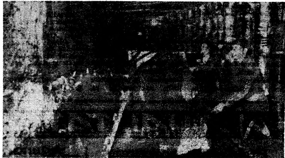
Abatajul complex mecanizat — realitate a mineritului zilelor noastre.

Angajați într-o activitate productivă rodnică, minierii, preparatorii, toți oamenii muncii din întreprinderile miniere își manifestă hotărîrea fermă de a traduce în fapt indicațiile secretarului general al partidului date cu prilejul vizitei de lucru în Valea Jiului. Programele stabilite cuprind căi concrete, clare, în vederea obținerii de noi succese în bătălia pentru a da patriei mai mult cărbune. Chiar din ziua următoare vizitei, organizațiile de partid au trecut la stabilirea de măsuri menite să ducă la sporirea producției în fiecare abataj și mină, la devansarea îndeplinirii planului și angajamentelor. Ce s-a făcut în acest sens, am încercat să aflăm discutînd cu diferiți oameni cărora le-am solicitat răspuns la întrebarea: Ce întreprindeți concret în perioada imediat următoare pentru creșterea producției de cărbune?