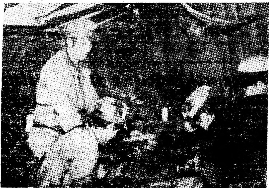
Se fac ultimele contacte la combină.

Totul e simplu și firesc, cind oamenii își fac datoria, cind au înțeles că pentru a da țării cit mai mult cărbune este nevoie de mecanizare