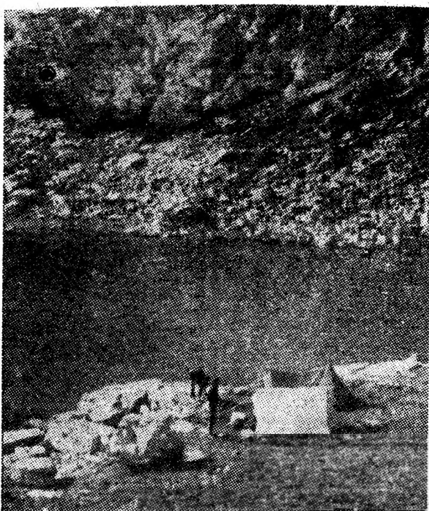
Lacul Gilcescu, podoabă a munților Paring.

Se spune că Retezatul este împărăția lacurilor glaciare, a „ochiurilor de mare”, mai albastre decît cerul. Și se mai spune că taurile Făgărașului au o mirifică strălucire de gheață, mîngiate de vînturi. Dar cine n-a străbătut sălbăticia Paringului, nu va ști niciodată că aici, verdelu întunecat al iezereilor pare împietrit pe veșnicie între stîncile căldărilor, ca o pedeapsă a timpului și ca o amintire a glacițiilor. Iată de ce ne-am propus să le cuprîndem într-un circuit complet, într-o drumeție montană care se abate de la linia crestei principale. Acest traseu se poate efectua în două zile, pornind de la cabana I.E.F.S. spre cabana Obîrșia Lotrului, sau în sens invers realizînd un circuit cu mult mai atrăgător.