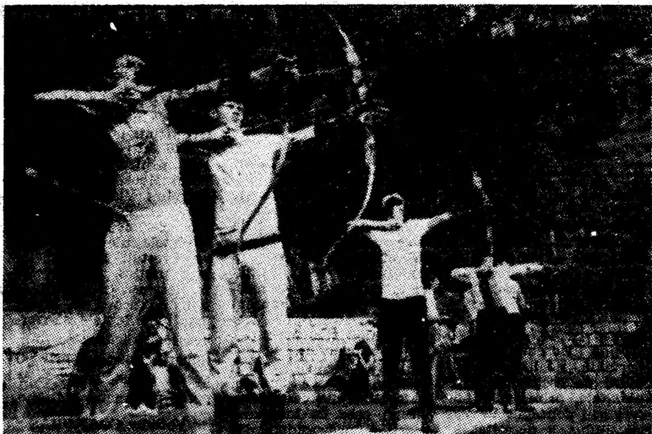
Campionatul a fost dominat de întrecerea strînsă dintre componenții „Minerului” și reprezentanții celorlalte secții afiliate la federația de specialitate.