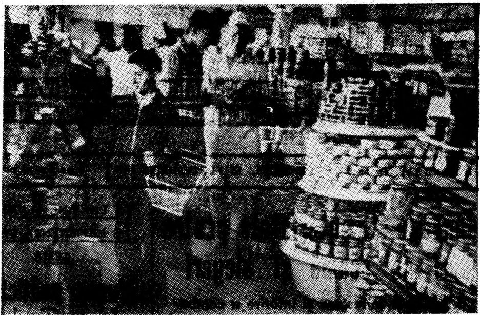
Aspect din cadrul complexului alimentar „Mercur”, amplasat în tinăruș cartier Corocești din Vulcan. Varietatea mărfurilor atrage zilnic numeroși cumpărători.