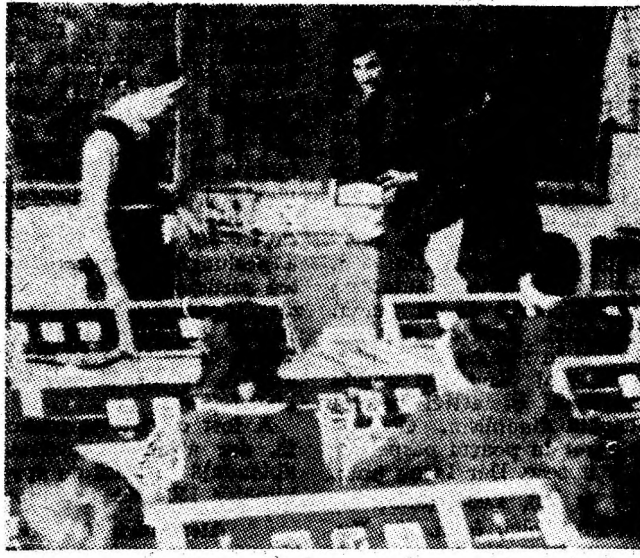
Instantaneu din laboratorul de fizică al Liceului industrial minier din Lupeni.

dispune de 36 laboratoare, 12 săli de proiectare-desen, amfiteatre, cabinete cu ateliere de producție aflate într-un susținut proces de modernizare, creînd condiții bune de studiu, de muncă și educație. Întreg potențialul științific al institutului, instituție care și-a format un prestigiu solid în cei 31 de ani de existență în Petroșani, trebuie orientat cu iermitate și prioritate spre problematica mineritului din Valea Jiului, acest fapt dînd eficiență educativă întregului proces de formare a specialiștilor chemați să realizeze în practica social-economică Programul partidului, documentele Congresului al XII-lea al partidului.