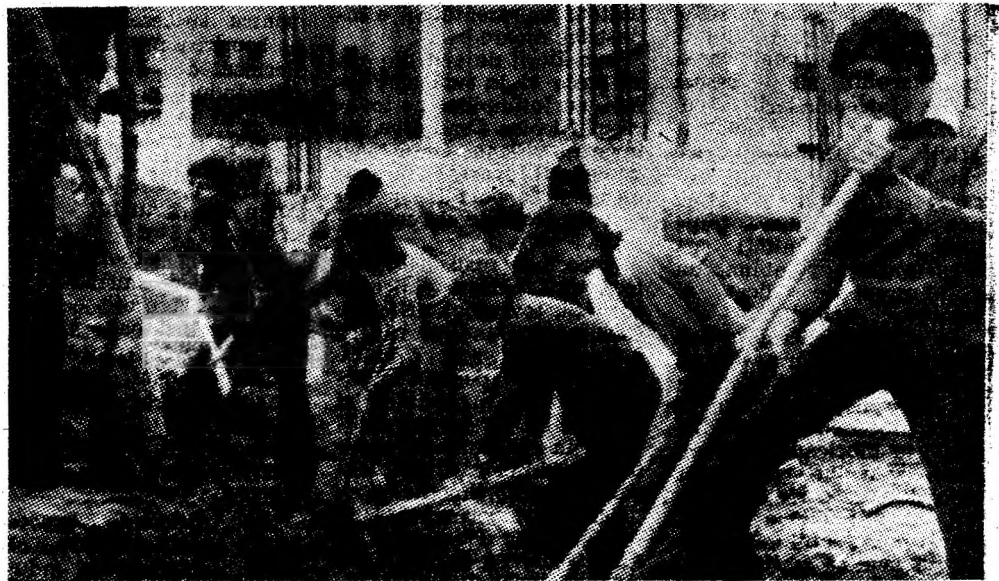
Șantierul de muncă patriotică, cadru de manifestare a educației tineretului școlar din Valea Jiului.