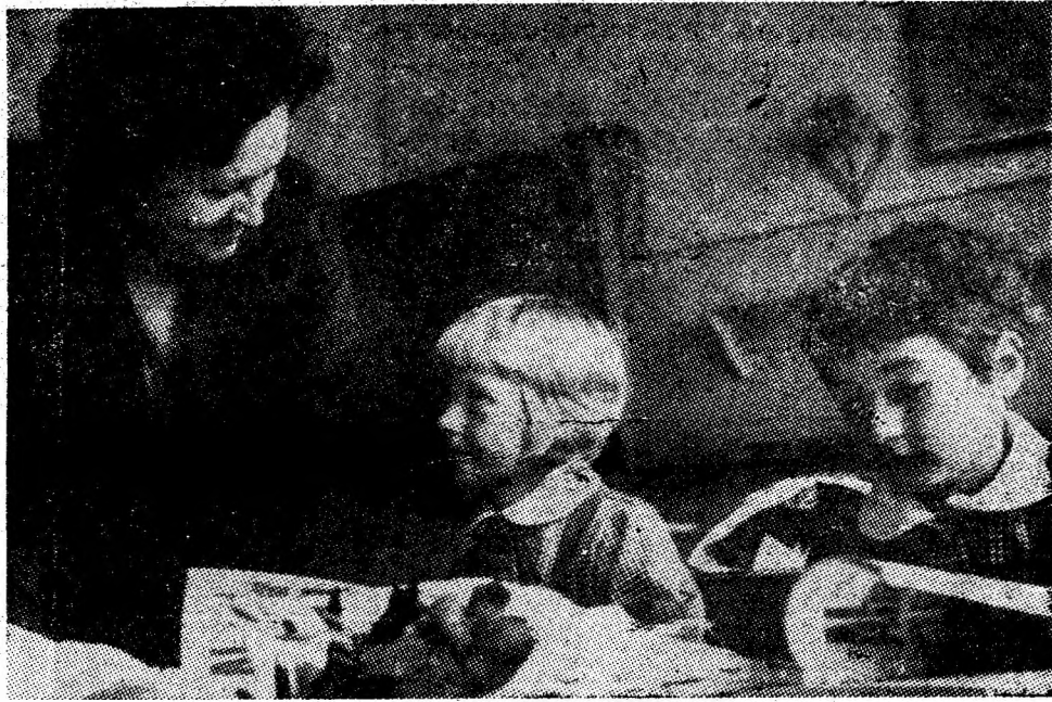
La școala generală nr. 1 din Petroșani, primul dialog între „tovarășă” și „boboci”.

După încheierea festivității, organizată cu prilejul deschiderii noului an de învățămînt la Institutul de mine, participanții la adunare au urmărit cu adincă interes, la televizor, cuvîntarea rostită de tovarășul Nicolae Ceaușescu, secretar general al partidului, la Timișoara, cu prilejul deschiderii anului de învățămînt 1979-1980.