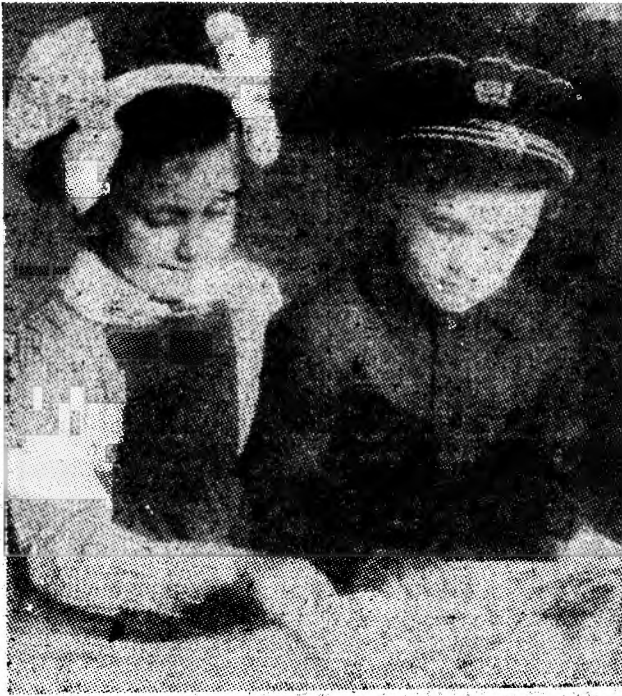
• Prima cunoștință cu abecedarul. Instantaneu de la Școala generală nr. 1 Lupeni.

Un rodnic în activitatea școlară este urarea pe care o adresăm acum, la începutul anului de învățămînt, tuturor elevilor și cadrelor didactice din Valea Jiului.