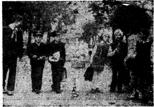
Spre casă cu cele mai frumoase impresii după prima zi de școală.