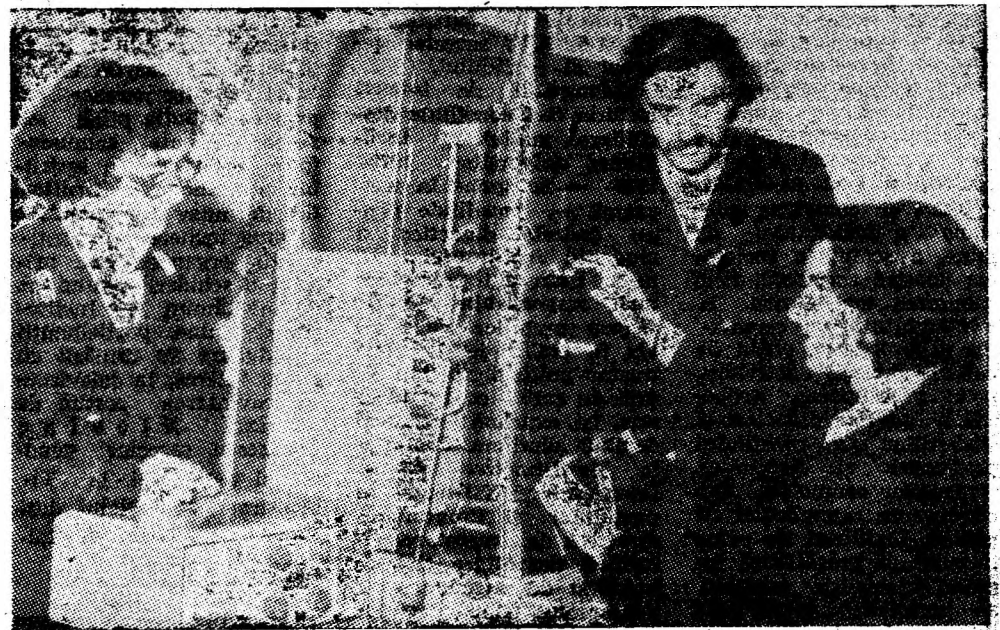
În sala de microscopie electronică a I.M.P. studenții fac cunoștință cu noile aparate electronice moderne intrate în dotarea institutului.