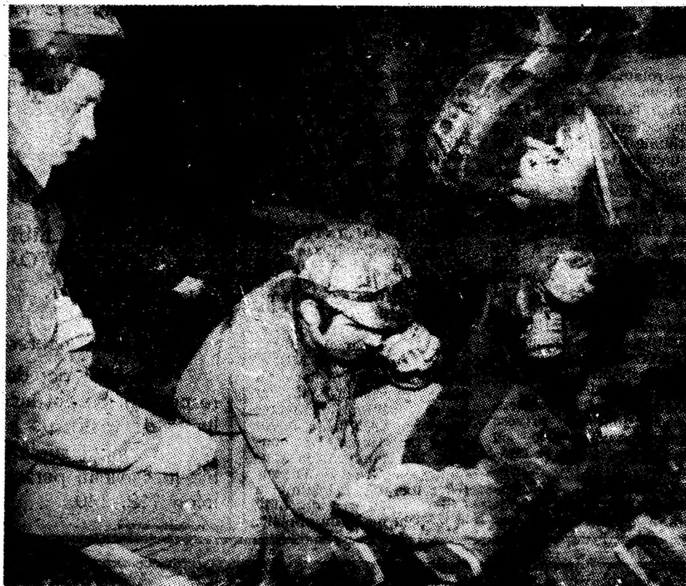
Mecanizarea rapidă a procesului de extracție a cărbunelui este azi o realitate în minele Văii Jiului. Minerii au învățat într-un timp scurt nu numai să minuiască mașinile moderne, dar să le și întrețină corespunzător.

Toate aceste aspecte ridicate de vorbitori din dorința de a îmbunătăți activitatea economică, au fost dominate de optimismul participanților, care în numele colectivelor pe care le reprezentau și-au luat angajamentul realizării sarcinilor de plan pe luna septembrie, a planului trimestrului IV, în condițiile pregătirilor intense necesare preluării producției anului viitor.