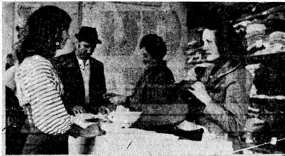
Noul magazin cu articole pentru copii nr. 120, deschis recent la parterul modernului bloc IM din orașul Vulcan.