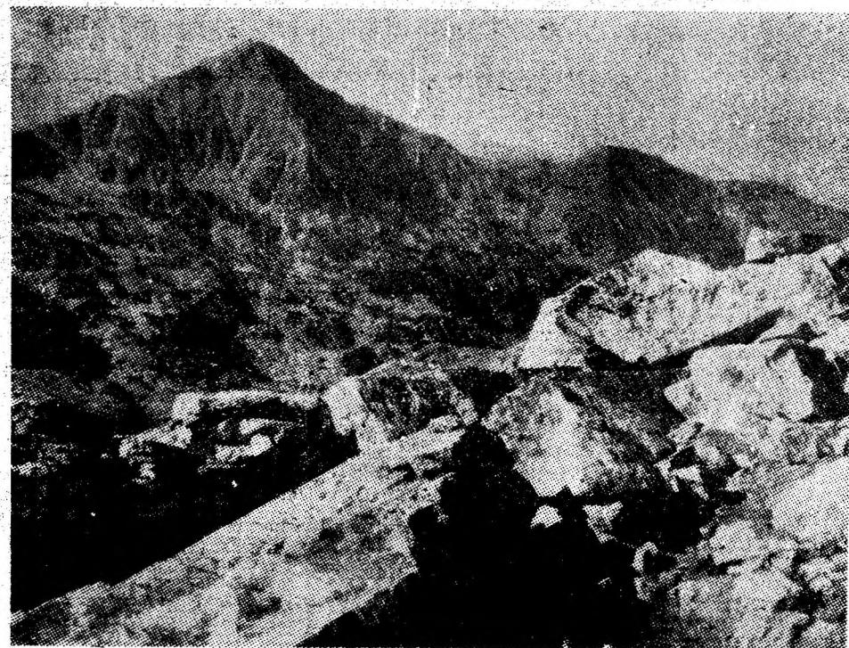
Priveliștea montană ne îmbie la drumeție — ațita timp cît zilele mai sînt încă frumoase.