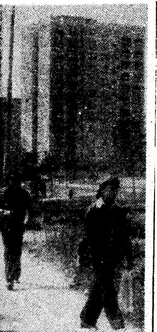
Toamnă în cartier.

De cîteva zile s-au terminat alegerile de partid, moment semnificativ în viața și munca comunistilor de la I.U.M. Petroșani. În toate organizațiile de partid au fost stabilite măsuri politice concrete, pe baza unor analize responsabile, comuniste. În spiritul ideilor enunțate de secretarul general al partidului la recenta consfătuire de lucru de la C.C. al P.C.R. Și cu acest prilej activitatea politică, de educare a oamenilor muncii, s-a aflat pe prim plan. Măsura utilității ei, a eficienței pe care o are în rîndul comunistilor, este dată de modul în care sînt realizate sarcinile economice, obiectivele stabilite pentru înfăptuirea programului de mecanizare a minelor din Valea Jiului.