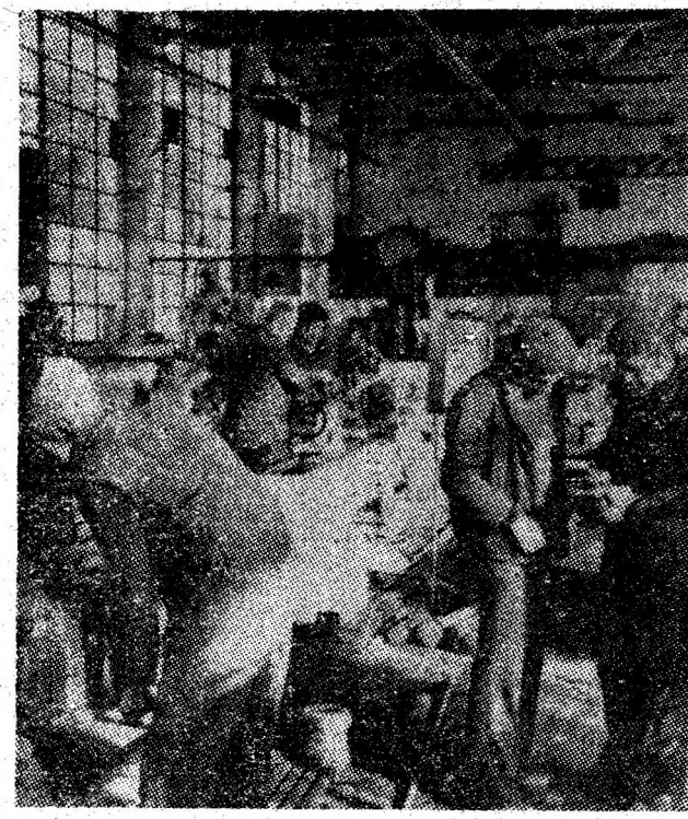
Instantaneu de muncă din atelierul electromecanic al minei Uricani.