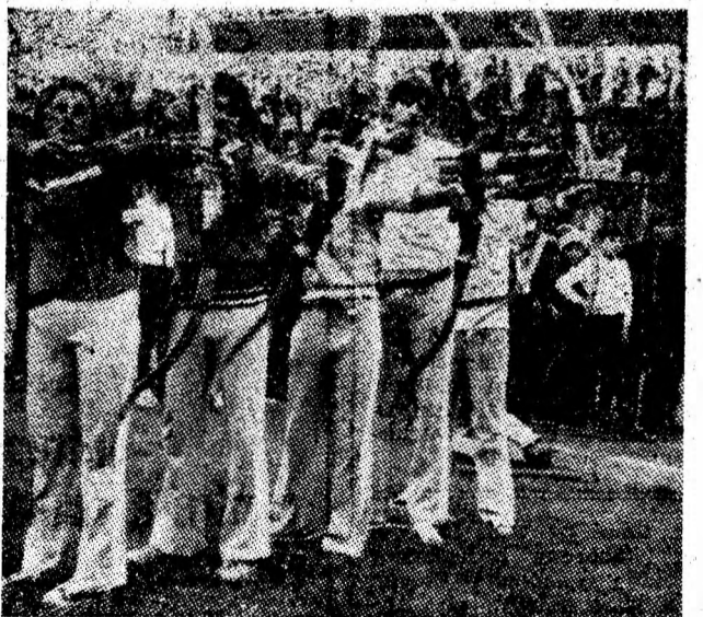
Arcășii și luptătorii elevi fac o demonstrație a talentului lor în fața spectatorilor.