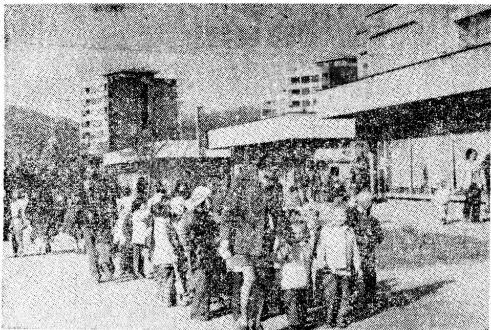
Cu „tovarășă“ prin moderna citadelă vulcăneană.