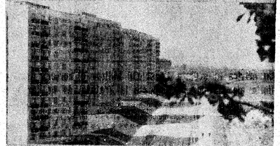
in întreg municipiul nostru.