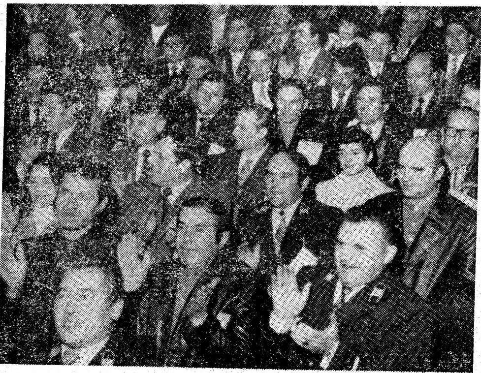
Aspect din sală, în timpul lucrărilor conferinței.