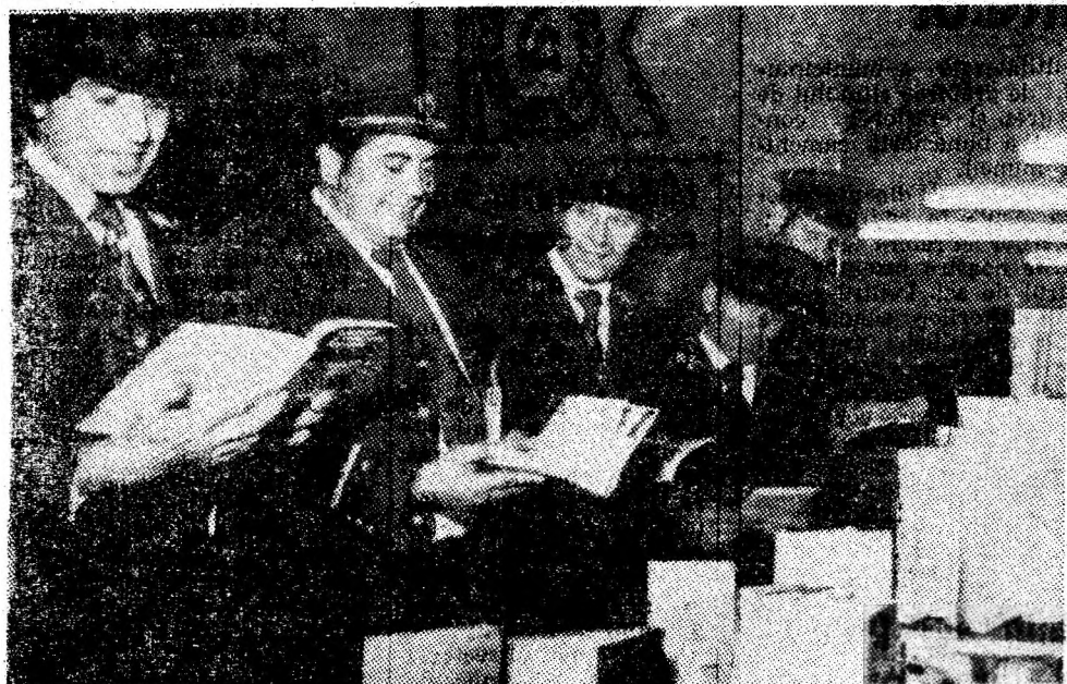
În pauza conferinței.