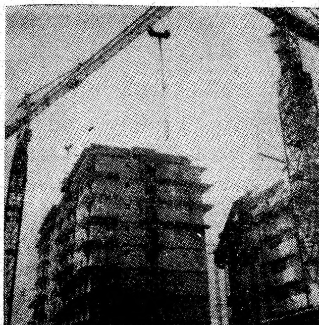
Un arc de triumf din beton și oțel: o imagine din Petrosani acestor zile — oraș în continuă expansiune spre înălțimi.

Marti, 23 octombrie, cu o săptămână înainte de încheierea lunii am realizat un raid prin 3 întreprinderi miniere — Lonea, Vulcan și Uricani — cu o temă de mare actualitate — stadiul îndeplinirii programului pregătirilor de iarnă. Dăm cuvîntul interlocutorilor noștri, pentru a vă informa cu realizările de pînă acum, cu stadiul lucrărilor în curs de execuție.